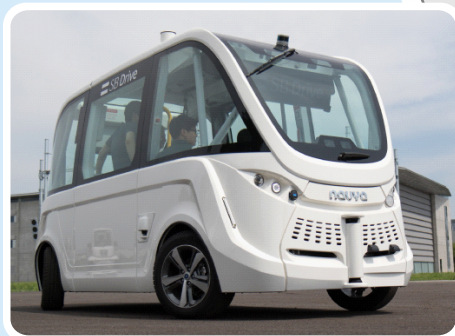
フランス ナビヤ社製のアルマ