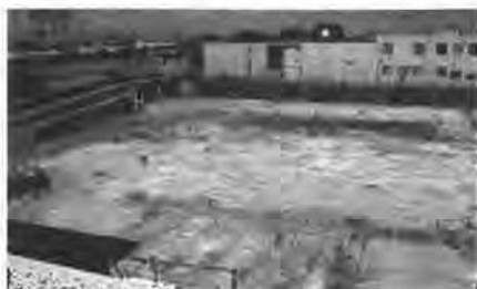
し尿処理施設屋上より、北東方向を望む。左手は食肉卸売市場。令和2年6月18日撮影

「ライフポート柳津」は今後も、し尿及び浄化槽汚泥の処理を継続してまいりますことから、運営を継続してまいります。