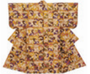
▲唐織 菊叢文様 黒紅地 江戸時代 浅井能楽資料館 佐藤芳彦記念 山口能装束研究所蔵

能楽で用いられる舞台衣装を能装束と呼びます。江戸時代、能楽は幕府の儀式で用いられる芸能となり、当時最高の素材と技術を惜しみなく使って能装束は作られました。写真は、女性役が表着(一番上に身に着ける装束)とする唐織です。唐織は金や銀の平箔(和紙に薄く伸ばした金銀箔を貼り、細く糸状に切ったもの)を織り入れて地文様を表したうえに、さまざまな色糸で文様を織りあげます。立体的な文様は刺しゅうのように見えますが、織物の技法です。また本作品は、菊の文様が叢のように空間を埋め尽くしていますが、色彩のバランスが美しく、圧迫感がありません。菊などの秋草は、能装束で好まれる文様です。用いられている技法や文様などにも注目して、格調高く優美な能装束の世界をお楽しみください。◆観覧料 高校生以上600円、小中学生300円 ※各種障がい者手帳、難病に関する医療受給者証をお持ちの人とその介護者1人は証明書などを提示すると無料。市内の中学生以下の方は無料。家庭の日(7月18日(日)、8月15日(日))に入館する中学生以下の方は無料。◆開館時間 午前9時～午後5時(入館は30分前まで)◆休館日 毎週月曜日(8月9日は開館)、8月10日(火)◆場所・問 歴史博物館(大宮町2-18-1・☎265-0010)◎関連イベントなどはホームページをご覧ください。