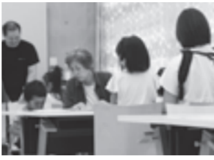
▲減災教室の様子(令和元年10月)

「大和Company」は、子どもたちが安心して健やかに育つ地域づくりを目指して活動しています。毎週日曜日にZoomを利用して開催している「オンライン個別減災教室」では、減災とはどういうことか、外出時に被災した際にとるべき行動は、家庭によって変わる備蓄品についてなどのさまざまな疑問に防災士が答えます。前日までに予約が必要ですので詳しくはホームページをご覧ください。また、Youtube(ユーチューブ)で防災・減災に役立つ情報を配信しています。事前に準備できる災害対策グッズなどを紹介していますので、ぜひご覧ください。 問 NPO法人大和Company・鈴木☎090-5874-6430、市民活動交流センター☎264-0011