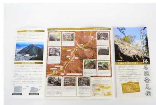
史跡岐阜城跡石垣マップ