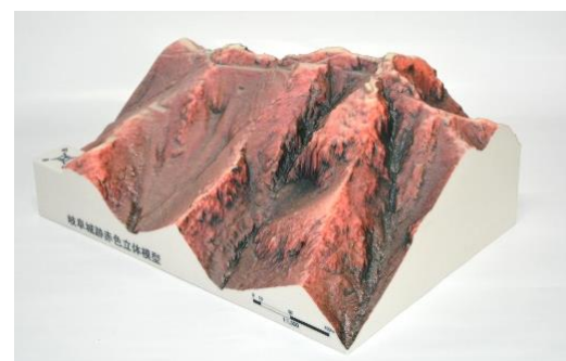
岐阜城山上部模型

曲輪：城の周囲に築かれた土や石垣などの囲い。 堅堀：敵の移動を防ぐため、山の斜面に城に対して垂直に掘られた堀。