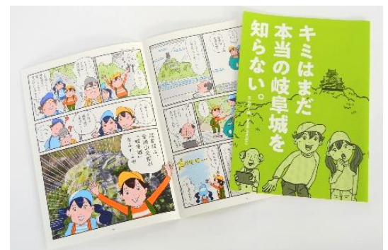
岐阜城紹介マンガ冊子 B5版カラー、24ページ

→令和2年度に、小中学生にタブレットが貸与されたことに伴い、冊子を 電子化、データ配信 を行うこととなった。