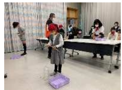
…昨年度の市子連主催の活動