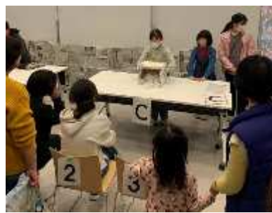
…昨年度の活動発表から