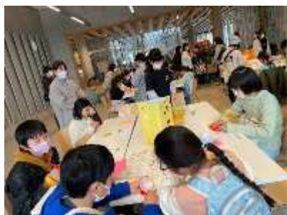
…昨年度の活動発表から

[参加状況により、時間や場所が変更になることがあります。その際は、事務局から連絡があります。]