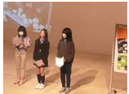
…昨年度のステージ発表の様子