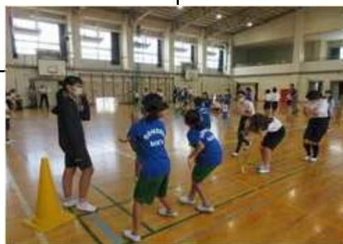
【2 ブロックフェスティバル(則武・早田) 6月24日(土) 則武小学校体育館】