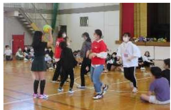
【日野子ども会インリーダー】