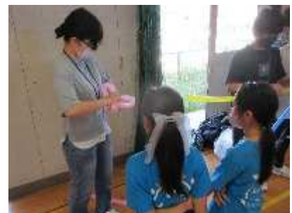
【5 ブロックフェスティバル 5 月 20 日(土) 教育研究所体育館】