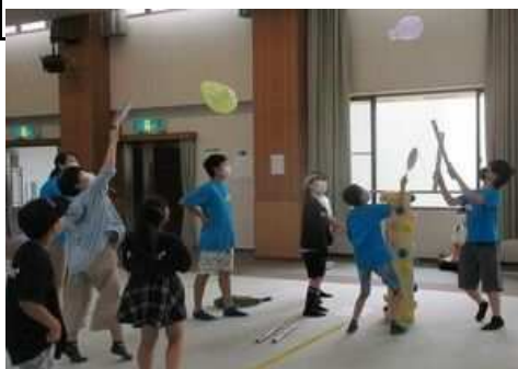
【1 ブロックフェスティバル 6月25日(日) 北部コミュニティセンター】