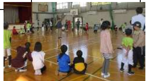
【茜部子ども会インリーダ】