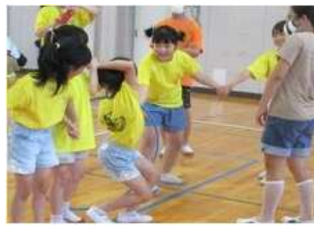
【3 ブロックフェスティバル 7月2日(日) 梅林小学校体育館】