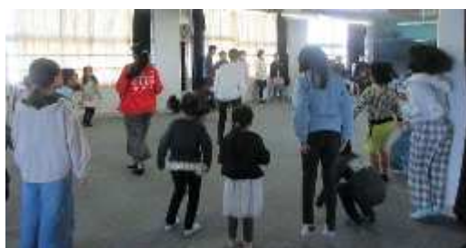
【合渡フェスティバル】