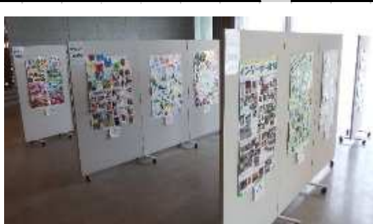
【「岐阜市壁新聞展」 1月17日(水)～20日(土) ぎふメディアコスモス】