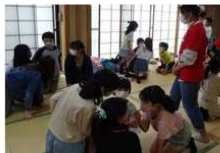
【常磐子ども会インリーダー】