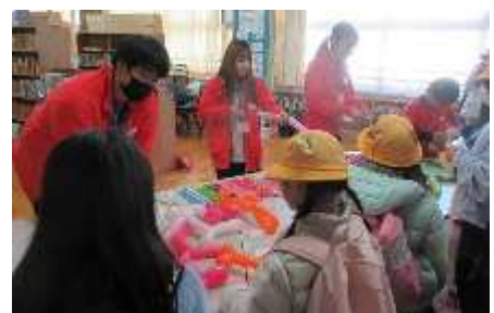
【七郷フェスティバル】