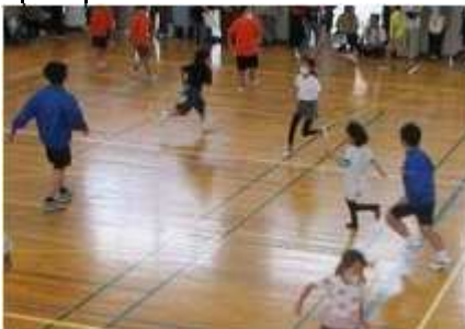
【4ブロックフェスティバル 6月11日(日) 厚見小学校体育館】