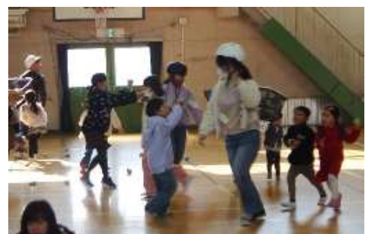
【梅林フェスティバル】