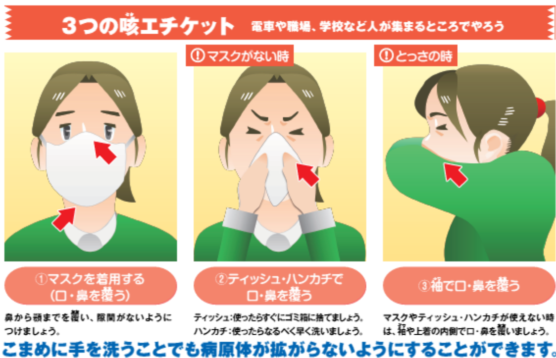
図3 咳エチケットについて