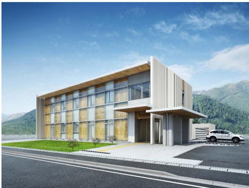
完成イメージ (外観)