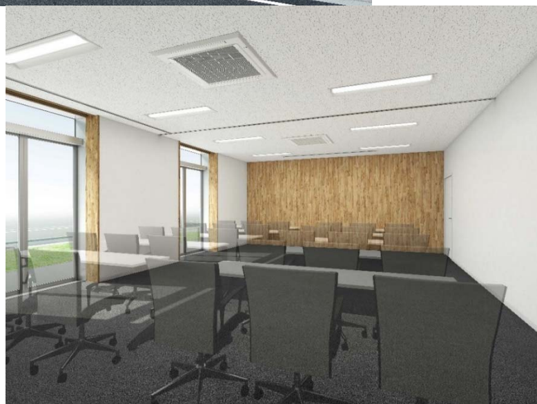
完成イメージ (室内)