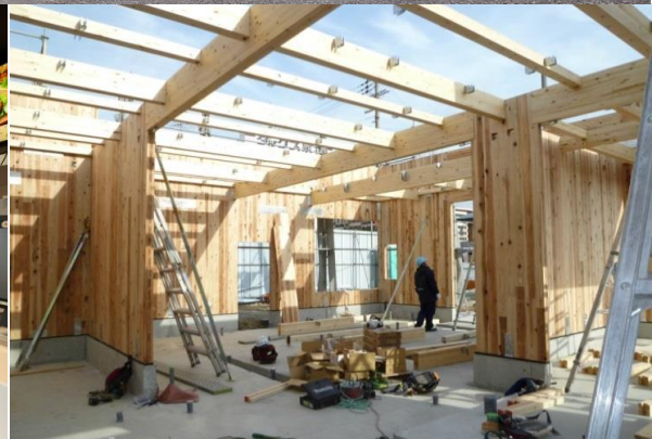
写真撮影 / 提供 : FROG PHOTO 仲田 弘二 / Sho建築設計事務所 畑 正一郎