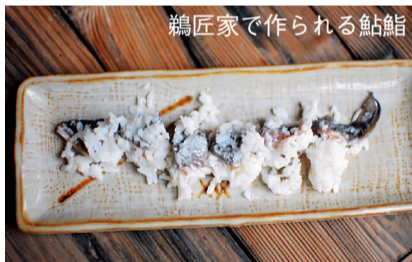
鵜匠家で作られる鮎鮓

献上されるようになりまし。現在も鵜匠には鮎鮓の製造技術が伝承されています。鵜飼を中心とした客をもてなすためのさまざまな技術や文化は今も伝承され、多くの観覧客を魅了しています。鵜飼文化は日本独自のものであり、現代まで途切れることなく受け継がれているものは長良川の鵜飼のみです。