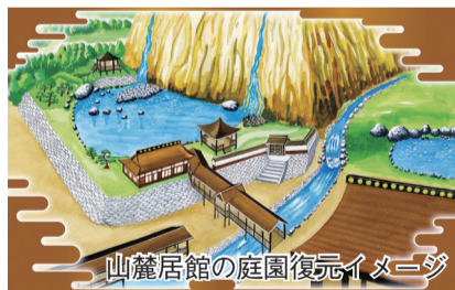
山麓居館の庭園復元イメージ

■国史跡「岐阜城跡・織田信長公居館跡」 平成23年2月7日に指定。範囲は山麓の織田信長公居館跡を含めた金華山国有林一帯の209ヘクタール。近年、岩盤を自然風加工した庭園が発掘調査により複数見つかり、その全体像が判明しつつあります。山上の城郭部分は石垣を用いて堅固に造り替えられましたが、信長公はその場所にも人を招きました。限られた人しか入れない特別な場所、通常は家臣が行うような案内や給仕を自ら行う、これが信長流のおもてなしでした。