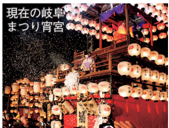
現在の岐阜まつり宵宮