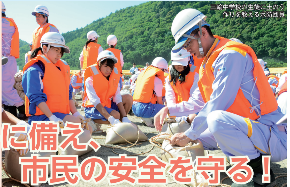
三輪中学校の生徒に土のう作りを教える水防団員

●第48回岐阜市水防連合演習(5月31日撮影、写真右2枚)では、水防団員らが、日ごろの訓練の成果を披露。この日は、三輪中学校と東長良中学校の生徒らも参加し、水防団員の指導のもと、「積土のう工」に挑戦しました。☎水防対策課☎214-4854