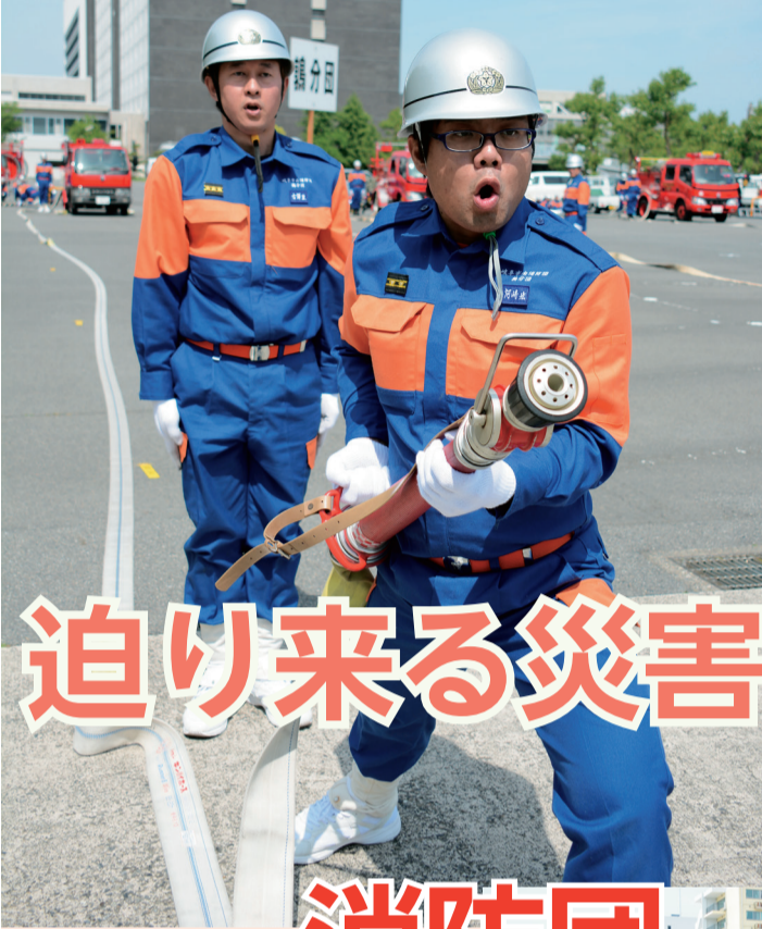
消防団員によるポンプ車操法

●第48回岐阜市水防連合演習(5月31日撮影、写真右2枚)では、水防団員らが、日ごろの訓練の成果を披露。この日は、三輪中学校と東長良中学校の生徒らも参加し、水防団員の指導のもと、「積土のう工」に挑戦しました。☎水防対策課☎214-4854