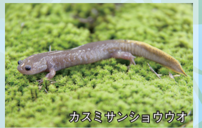
カスミサンショウウオ