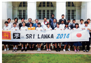
青少年国際教育夢プロジェクト 夢inスリランカ 『自分の夢が決まったとともに課題も見えてきました。人のために生きることの大切さを学びました』

平成26年度もさまざまな事業に活用させていただきました。その一部といただいた声をご紹介します。