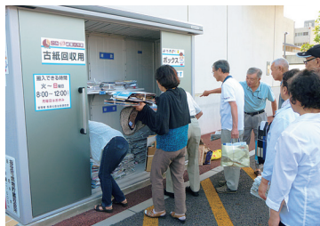
エコボックス設置事業 『すぐにたまってしまいう紙類を、近くで、少しずつ、いつでも、分別排出できることは、とても助かります』