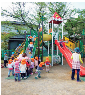
総合遊具設置事業 『毎日子どもたちが喜んで遊んでいます』