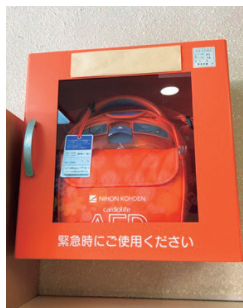
福祉施設AED設置事業