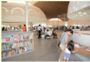
▲多くの人でにぎわう中央図書館の館内

本を通して人の思いをつなぎ合う場所でありたいと思います。その一環として、市民の皆さんが薦める本を選んでコメントを添える市民の本棚を作りました。それぞれが語る本への思いを、読んで、「この本、面白いかも」と本