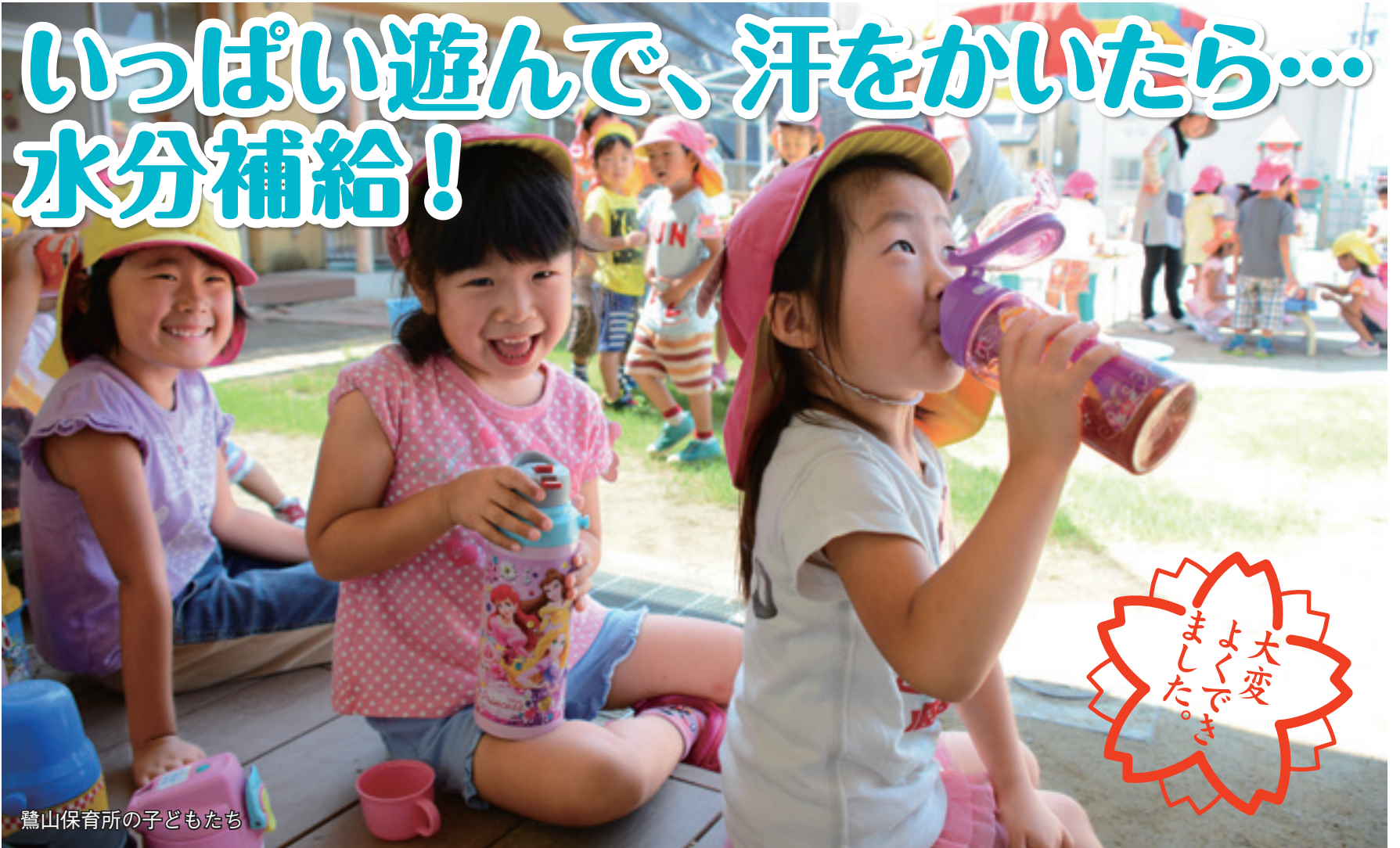
鷺山保育所の子どもたち