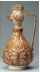
▲加藤卓男(人間国宝) 「ラスター彩唐草文鶏冠壺」