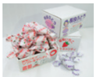
岐阜いちご&長良ぶどうソフトキャンディ

◆応募方法・問 ①希望の賞品番号、②郵便番号・住所、③氏名、④性別、⑤年齢、⑥電話番号、⑦広報ぎふで取り上げてほしいテーマ(「教育」や「健康」など具体的に)、⑧広報ぎふの全般的なご感想・ご意見を、はがきまたはEメール(件名は「広報ぎふ1月1日号プレゼント」)で1月7日(木)(必着)までに広報広聴課「広報ぎふ1月1日号プレゼント」係