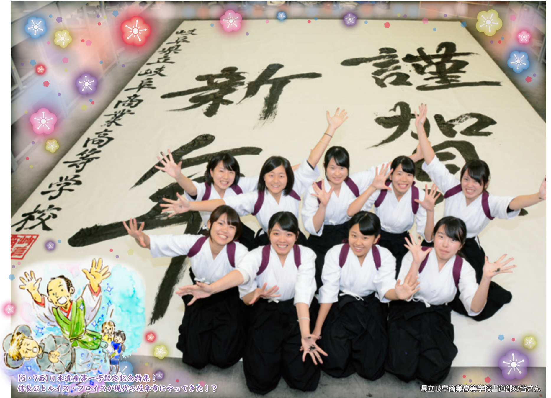
[6・7面]日本遺産第一号認定記念特集! 信長公とルイス・フロイスが現代の岐阜市にやってきた!?