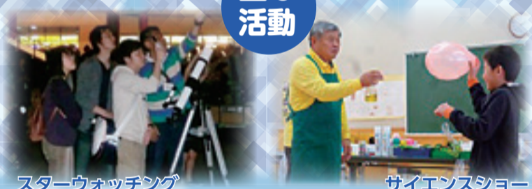
スターウォッチング