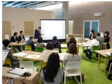
外国人市民向け説明会 (1/10)