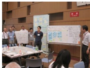
成果発表の様子 (第3回)