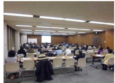
市民有志への出前講座 (2/24)