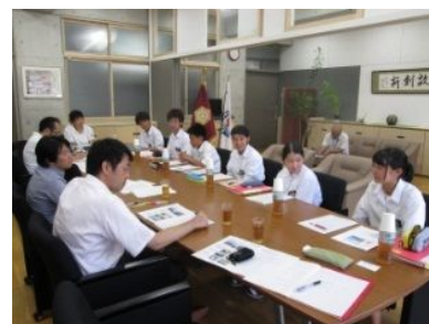
中学生との意見交換(7/14)