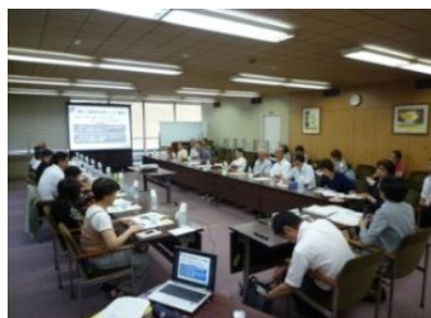
障がい者関係団体の方々との 意見交換(7/31)