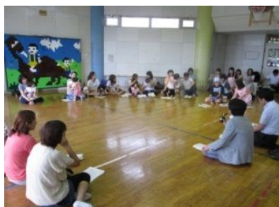
子育て世代の方々との 意見交換(7/16)