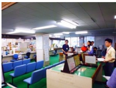
現庁舎見学の様子 (第2回)