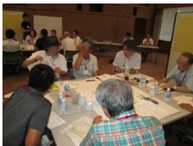
グループワークの様子 (第1回)