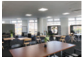
▲Neo work-Gifu 内観