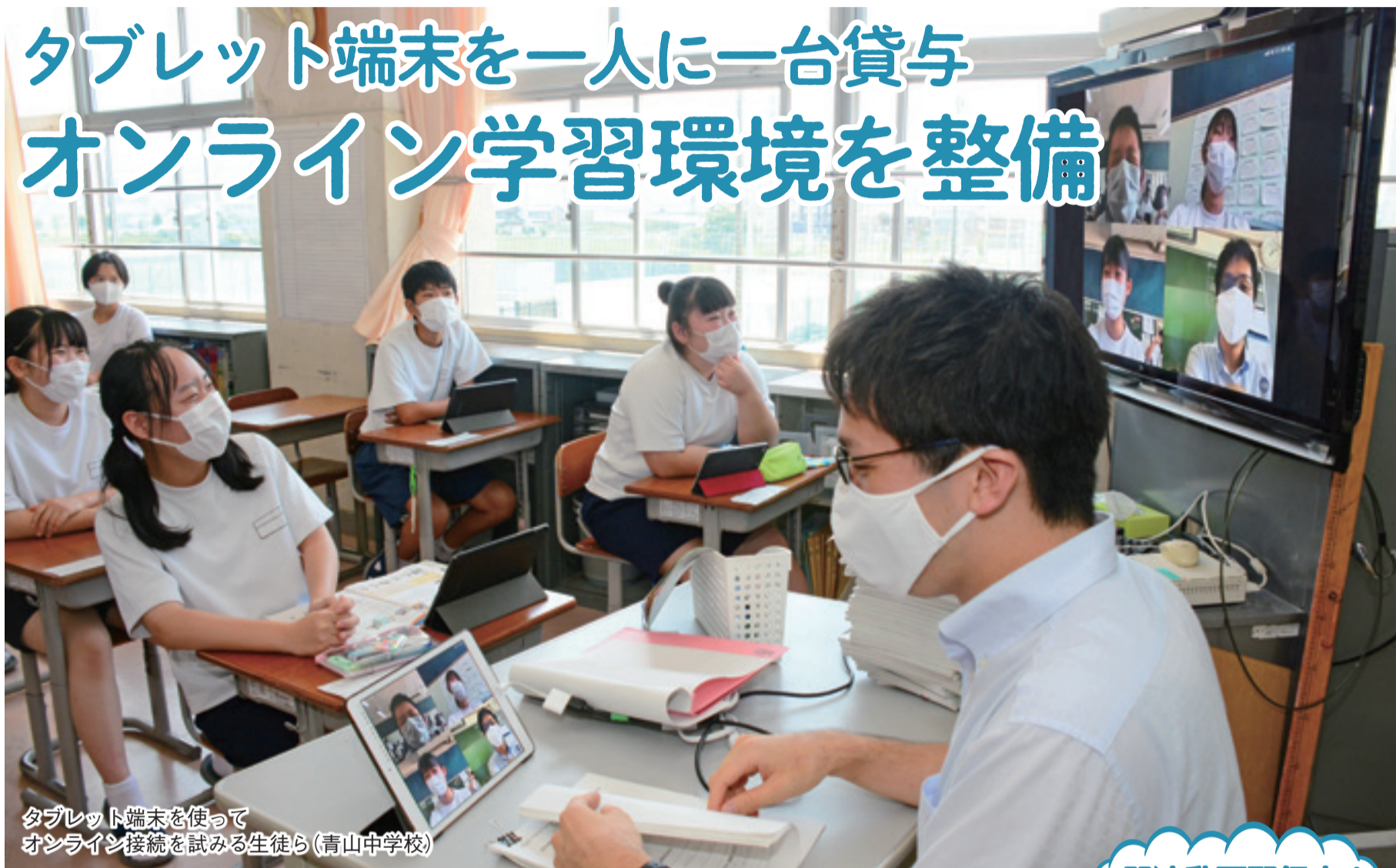
タブレット端末を使って オンライン接続を試みる生徒ら(青山中学校)

タブレット端末を使ったオンラインによる学習支援を充実させるため、市は市内小中学校の全校児童・生徒に一人一台のタブレット端末の貸与を進めています。6月には、中学校3年生約3,300人に、タブレット端末の貸与が完了しました。7月の大雨警報による休校時には、実際に端末を使って、「オンライン朝の会」を行う学校もあるなど、実践的な活用を進めています。今後、新型コロナウイルス感染症の影響により休校となった場合にも、きめ細かな学習支援が行えるよう整備していきます。☎教育研究所☎241-2114