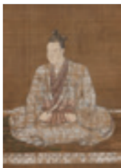
▲明智光秀画像(部分、本徳寺蔵) 展示期間：9/18～24

大河ドラマの主人公である明智光秀の生涯を中心に、織田信長や斎藤道三、豊臣秀吉、細川幽斎(藤孝)、ガラシャといった主人公を取り巻く人々にもスポットをあて、これらの人物にまつわる資料や同時代の文化財などを紹介することで、光秀の人物像と彼が生きた時代を浮き彫りにします。◆観覧料 高校生以上1,200円(1,000円)、小中学生600円(500円) ※( )はオンラインによる事前予約の平日割引料金。※当日券は混雑状況により販売制限があるため、オンラインによる事前予約をおすすめします。詳しくは歴史博物館ホームページをご覧ください。◆各種障害者手帳をお持ちの人とその介護者1人は観覧料が無料 ※大河ドラマ館(2階で開催)の入場には別途入場券が必要。大河ドラマ館の入場券をお持ちの方は当日に限り100円割引(小中学生50円割引)で当日券を販売。◆麒麟がくる 岐阜 大河ドラマ館との共通券(事前予約のみ販売)＝高校生以上1,480円、小中学生740円 ◆開室時間 午前9時～午後5時(各出および9月20日(日)・21日(月・祝)は午後6時まで) ※入館は30分前まで ◆休室日 10月12日(月)・13日(火) ◆場所・☎ 歴史博物館(大宮町2-18-1・☎265-0010)