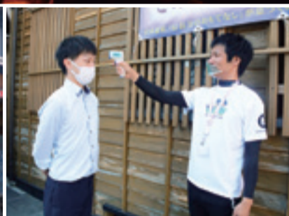
△乗船前に乗客の体温計測