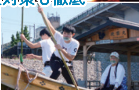
△船員は透明衛生マスクを着用