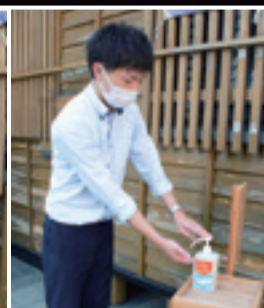
△乗客は手指の消毒