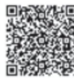
▲健康状態チェックカード