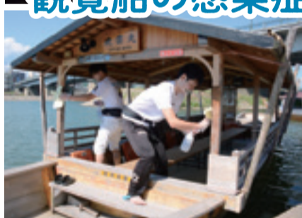
△乗船前に観覧船は徹底消毒