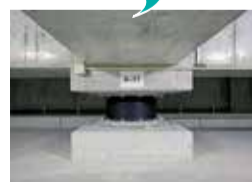
▲免震装置(イメージ)