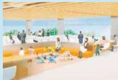
▶2階フロアに設ける キッズコーナー