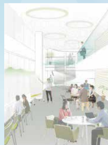
▲中高層階に設ける多目的スペース

◎次回（広報ぎふ8月15日号）は、新庁舎の防災機能についてご紹介する予定です。また、引き続き、市民の皆さんのご意見をお待ちしております。