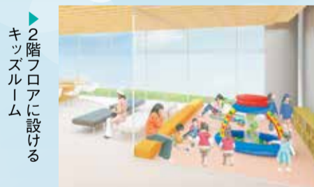
▶2階フロアに設ける キッズルーム