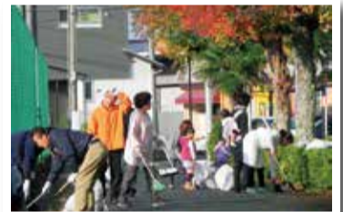
木之本 クリーンシティ活動