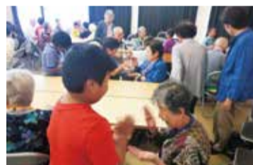
白山 ふれあいの集い