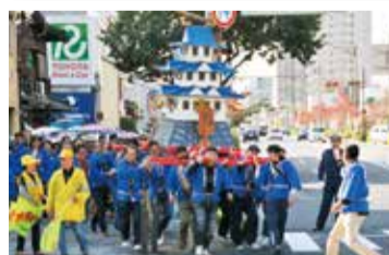
加納東・加納西 美濃中山道ふるさとまつり