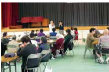
木之本 高齢者昼食会

高齢者に対する見守り活動や高齢者が集う福祉サロンの運営、日頃の声かけ運動など、地域で支え合う福祉活動を行っています。