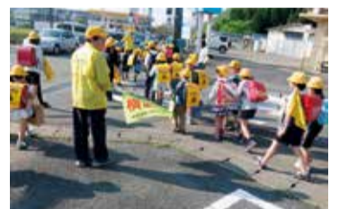
岩 岩っこみまもりたい