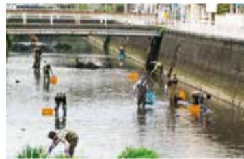
白山 岩戸川清掃活動

快適な環境を維持し、地域の皆さんがごみを出しやすいよう、ごみステーションを設置し、清掃やカラス除けネットの管理などを行っています。また、河川や水路、道路や公園などの共有施設の清掃活動にも積極的に取り組んでいます。