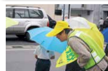
木之本 登下校見守り活動、青色パトロール