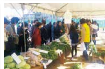
京町 ふれあい市場