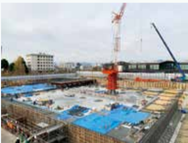
▲基礎工事の施工状況

現在、建築中の新庁舎は、本市の特性ある気候や風土を活かし、これを再生可能エネルギーとして積極的に活用し、環境と省エネルギーに配慮した庁舎としています。その結果、新庁舎の環境性能は高く評価され、全国共通の指標である「建築環境総合性能評価システム(CASBEE〈キャスビー〉)」で、最高ランクであるSランクを取得するとともに、省CO2の実現性に優れたプロジェクトとして、国の「サステナブル建築物等先導事業」にも採択されました。