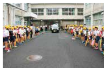
方県 青色パトロール出発式

地域の防犯力を高めるための地域パトロールや、児童の登下校時の見守り活動、防犯灯の設置や管理など、地域の安全・安心なまちづくりのため、個人では対応できない地域での活動を行っています。