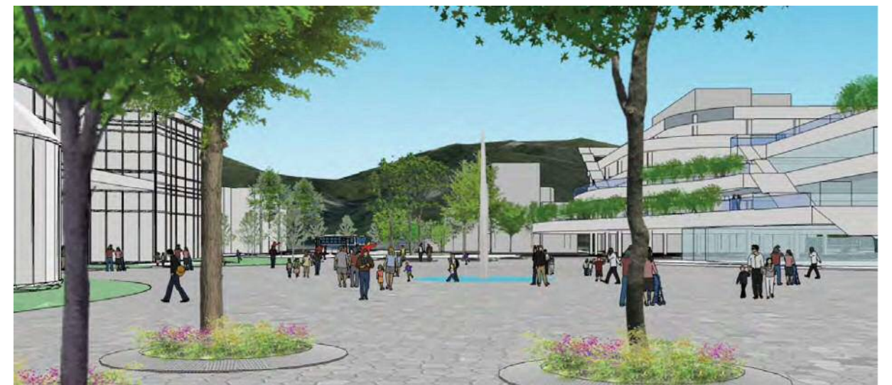
テニテオから「みんなの広場 カオカオ」を臨む（イメージ）