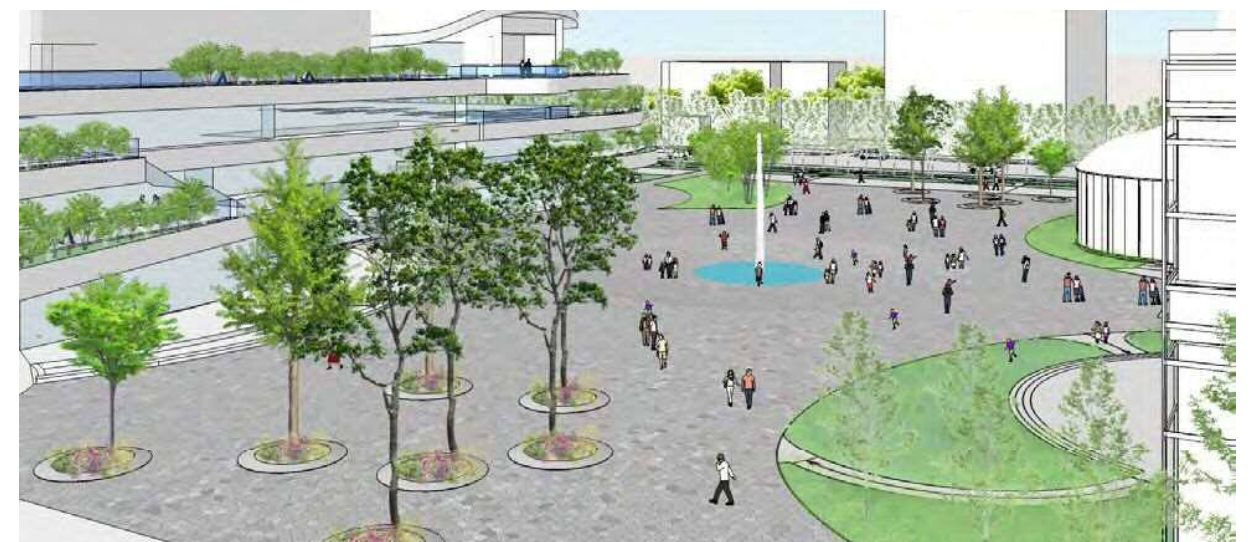
旧岐阜県庁舎から「みんなの広場 カオカオ」を臨む（イメージ）