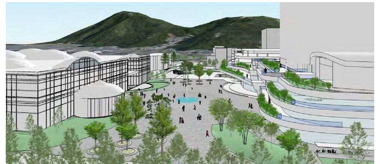
金華橋通りから「みんなの広場 カオカオ」を臨む（イメージ）

低層部のテラスには、「平和の鐘」を設け、つかさのまちに、時を知らせるとともに、この地から、恒久の平和を願うメッセージを発信するシンボルにしたいと考えています。