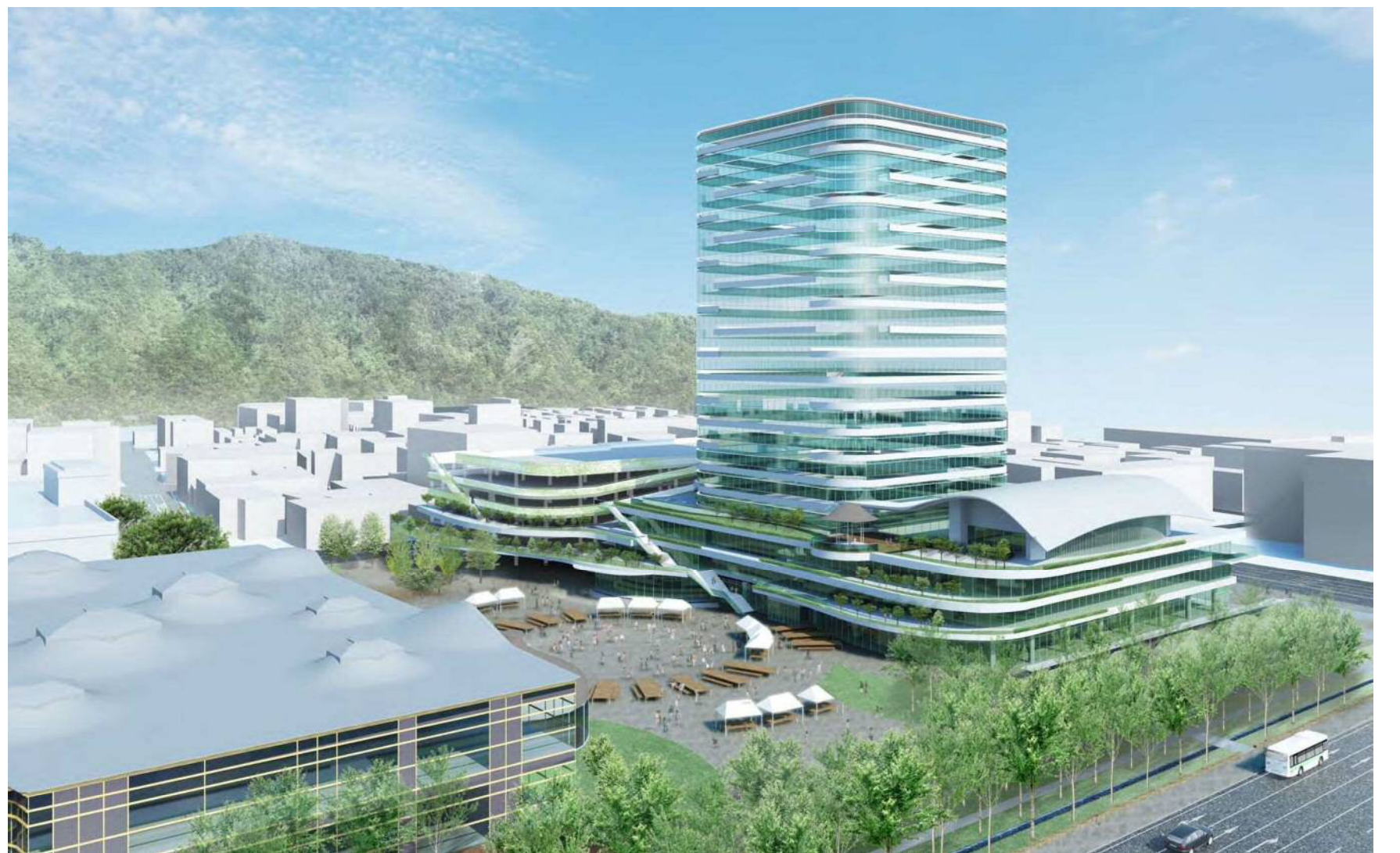
○みんなの広場 カオカオに向けて開かれた「みどりの丘」