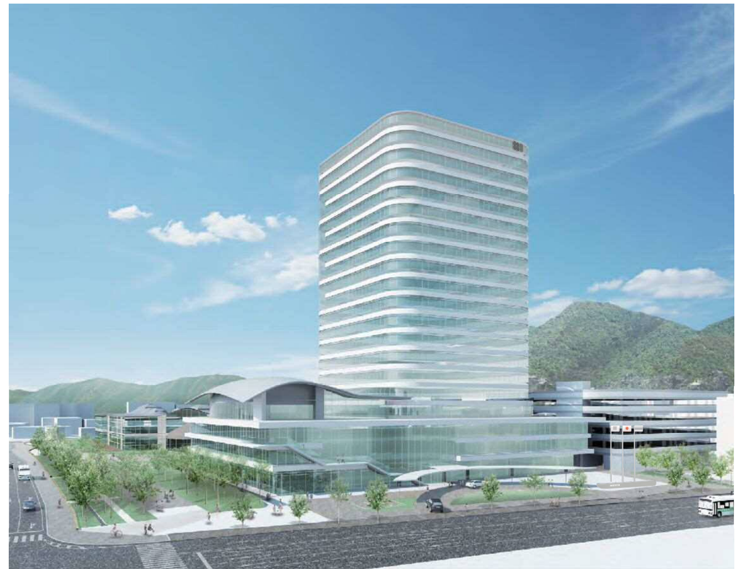
○敷地南側の県道岐阜各務原線から見た新庁舎(イメージ)