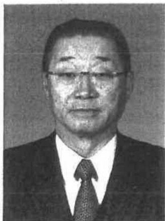
全国市議会議長会会長 札幌市議会議長