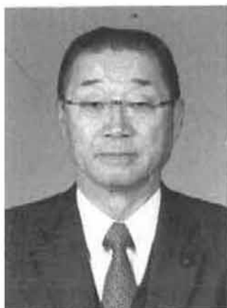
全国市議会議長会会長 札幌市議会議員