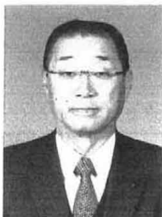
全国市議会議長会会長 札幌市議会議員