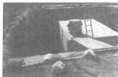
白山小学校に設置工事中