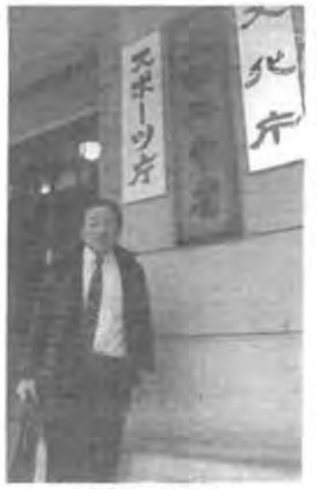
文部科学省玄関前