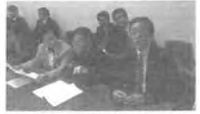
財務省へ陳情し説明を受ける