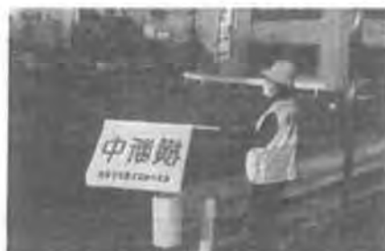
竜田町2丁目交差点