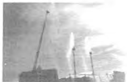
30m・50mはしご車の放水