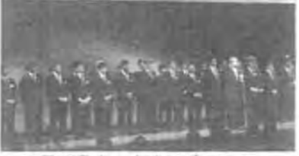
2月18日キックオフパーティー