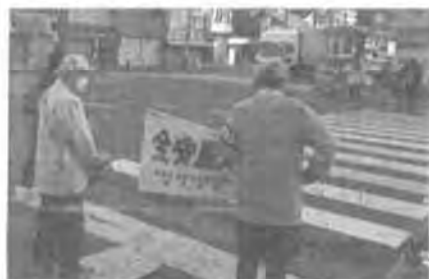
金園町4丁目交差点

特に、毎月(基本的に15日)行われる「岐阜市内一斉交通安全街頭指導」では、早朝7時半～8時半の間、各地域にて制服制帽で身を固め、黄色い旗を持って地域住民や子ども達の交通安全を守ると共に、交通安全の啓発に努めてみえます。