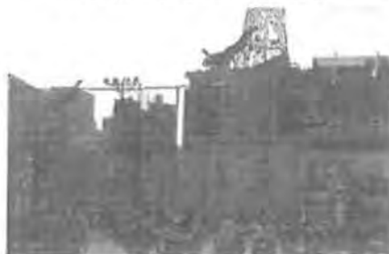
はしご登り演技の様子