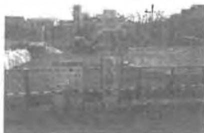
梅林小学校に設置工事中

白山小学校と梅林小学校は、本年度(平成30年度)40トンの超水槽を設置しました。