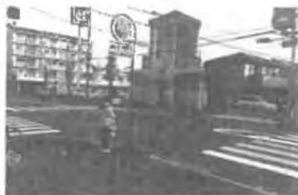
竜田町6・7丁目交差点