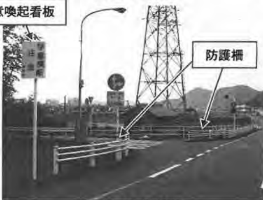
ドライバーへの注意喚起例

⑥ 5月8日に大津市で発生した交通事故を受けて、本市が管理する歩道が設置されている道路のうち、