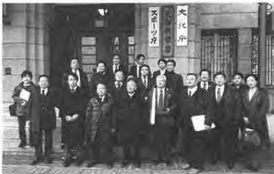
平成30年度国会要望