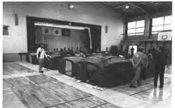
体育館での避難訓練の様様（イメージ）