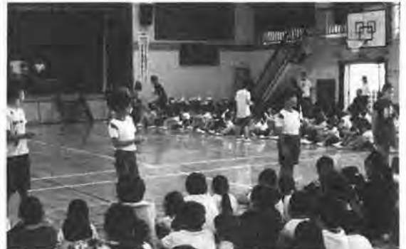
体育館での授業の様様（イメージ）

自民党岐阜市市議団は毎年1、2回の国会要望活動を行っています。今年2月には文部科学省に対し、公立小中学校等における空調設備等の設置について要望書を渡しました。