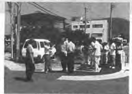
平成26年度 現地点検の様子

④ 平成24年度に、京都府亀岡市などで登下校中の児童生徒等が巻き込まれる事故が発生したことを受け、平成26年までに、学校関係者、警察等が連携し、「通学路緊急合同点検」を行い危険箇所に対する通学路の安全対策を実施。