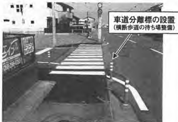
歩車道境界等の明示例

⑤ 本年度からは、本市が掲げる「こどもファースト」を推進するため、学校関係者などの各関係機関と連携し、防護柵の設置や横断歩道の待ち場の整備などを行う「通学路安全対策事業」を新規事業として(当初予算900万円)進めています。