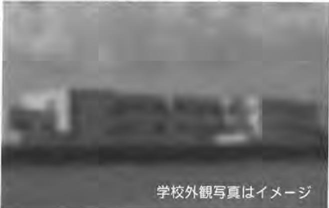
学校外観写真はイメージ

このことを思い知らされる今日このごろ。テレビや新聞で大きく取り上げられたことから、よくご存知のことでしょう。いじめのサインがありながら放置された揚げ句、未来ある子どもが自殺で命を絶ち、健康維持のための検診であるはずなのに、いい加減な事務対応による誤通知で死に至らしめてしまったこと。市のために働く若い女性にとんでもない愚行を繰り返したセクハラ親父。いずれの件も言語道断であることはいうまでにありませんが、市・議会ともに「緊張感が全く足りないからこそ!」と肝に銘じなければなりません。