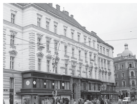
姉妹都市／ウィーン市 マイドリング区

盟約調印年月日 昭和63年5月11日 国名 アメリカ合衆国 人口 約30万人 面積 206km 2 気候 大陸性森林気候 産業・特産物等 機械・化学工業