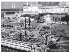
姉妹都市／シンシナティ市

盟約調印年月日 昭和57年2月22日 国名 ブラジル連邦共和国 人口 約118万人 面積 796km 2 気候 サバンナ性気候 産業・特産物等 IT産業・電気機械類・農業