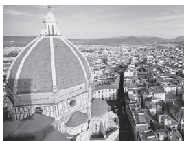
姉妹都市／フィレンツェ市

盟約調印年月日 昭和53年2月8日 国名 イタリア共和国 人口 約38万人 面積 102km 2 気候 地中海性気候 産業・特産物等 手工芸品・ファッション・観光産業