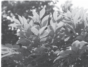
市の木 つぶらじい

この地は古くは「井の口」と呼ばれ、織田信長が「岐阜」の名を全国に広めた。この由緒あるいわれに基づき、「井の口」の「井」をもって本市の市章と定めたものである。 (明治42年8月27日制定)