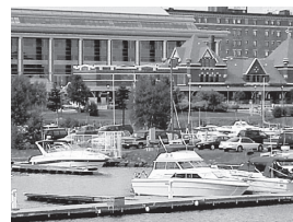
姉妹都市／サンダーベイ市

盟約調印年月日 平成6年3月22日 国名 オーストリア共和国 人口 約9万人 面積 8.2km 2 気候 西岸海洋性気候 産業・特産物等 商店街の共存する住宅地