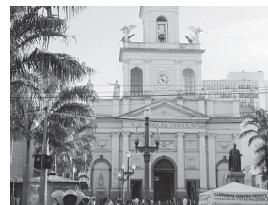
姉妹都市／カンピーナス市

盟約調印年月日 昭和54年2月21日 国名 中華人民共和国 人口 約947万人 面積 16,596km 2 気候 モンスーン性気候 産業・特産物等 茶・生糸・絹織物・観光・IT産業