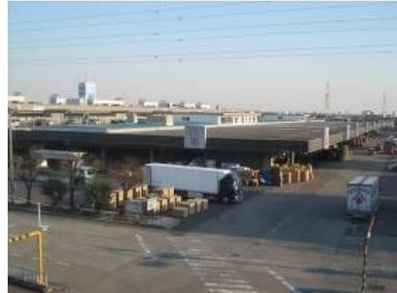
建物の用途及び構造（令和2年3月31日現在）