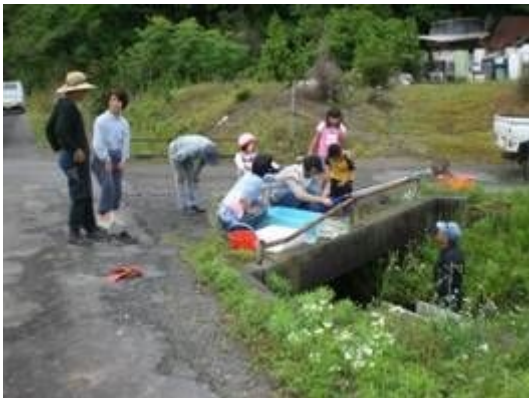
水路の生き物調査

現在、14組織（上城田寺、打越、太郎丸、福富、春近・溝口、岩利、長森、芥見、東改田、岩田・岩滝、三輪、方県南、下城田寺、安食）がこの事業に取り組んでいます。