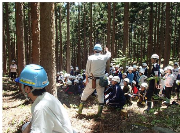
たずさえの森の体験学習（郡上市 高鷲地内）