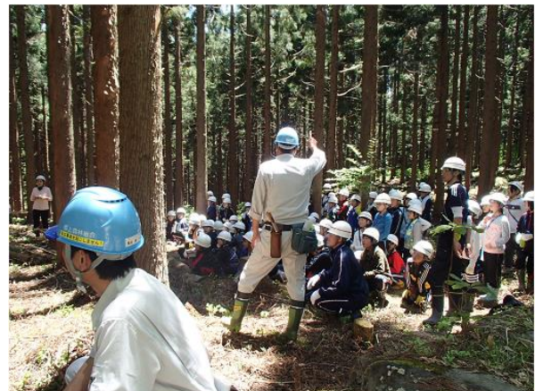
たずさえの森の体験学習（郡上市 高鷲地内）