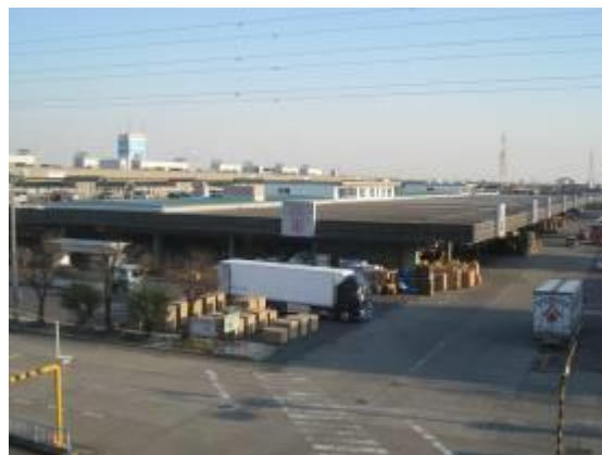
建物の用途及び構造（平成29年3月31日現在）