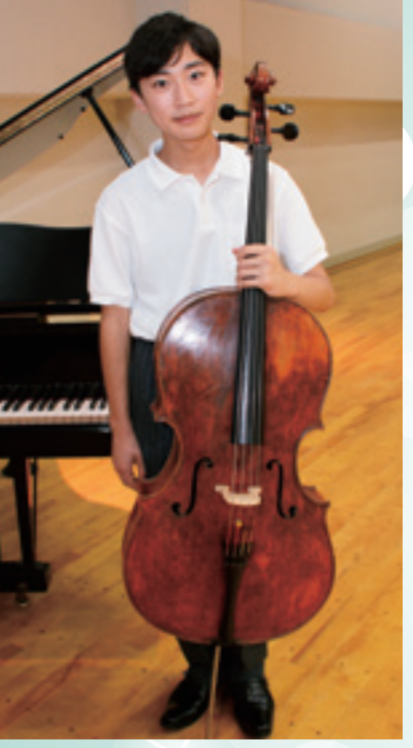
・D.Popper国際チェロコンクール II部門 1位受賞(2013年) ・岐阜国際音楽祭コンクール 小学生の部 1位受賞(2014年) ・泉の森ジュニアチェロコンクール 中学生の部 金賞受賞(2016年)