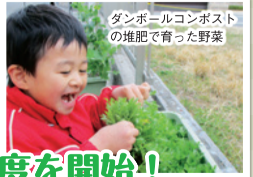
ダンボールコンポストの堆肥で育った野菜