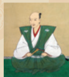
▲重要文化財 織田信長像(部分)(長興寺蔵)