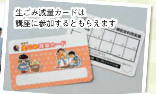
生ごみ減量カードは講座に参加するともらえます