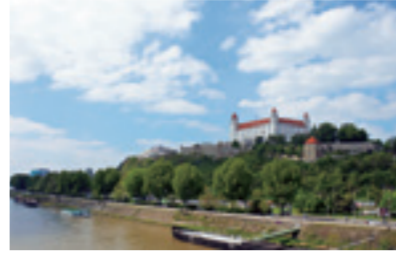
▲首都ブラチスラバ市の風景(ドナウ川とブラチスラバ城)

ホストタウンとは、2020年の東京オリンピック・パラリンピック競技大会開催に向け、スポーツ立国、グローバル化の推進、地域の活性化、観光振興などに資する観点から、全国の地方公共団体が、大会参加国・地域との人的・経済的・文化的な相互交流を行うものです。ホストタウンの取り組みは、政府が推進しており、現在全国で179件が登録されています。岐阜市は、昨年12月9日にスロバキア共和国を相手国として登録されました。