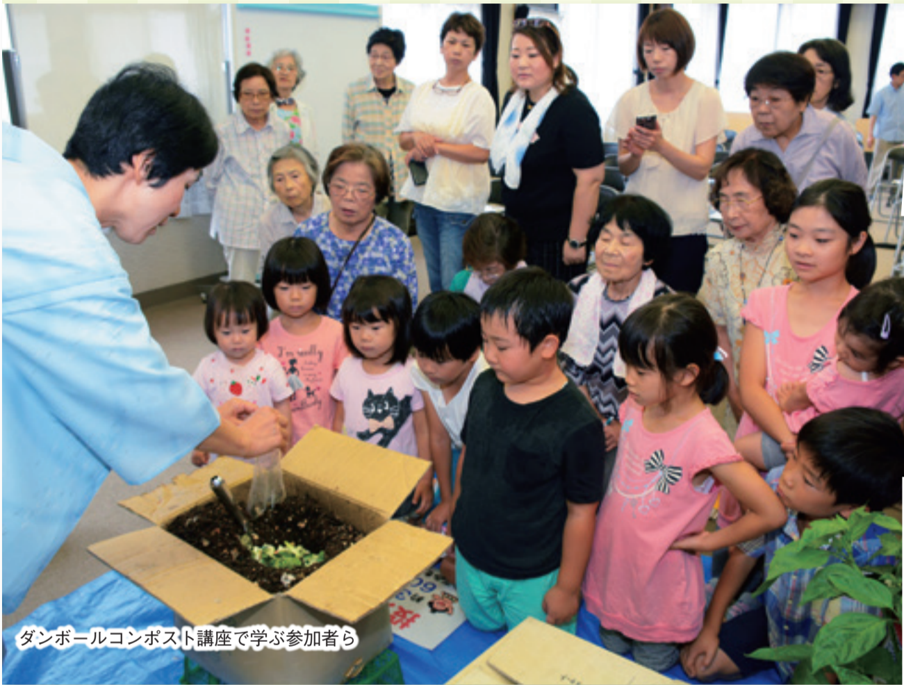
ダンボールコンポスト講座で学ぶ参加者ら