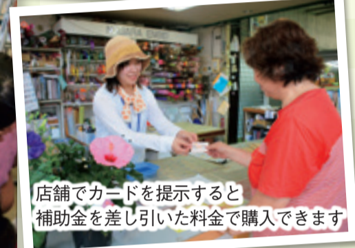
店舗でカードを提示すると補助金を差し引いた料金を購入できます