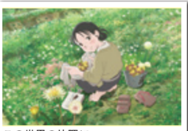
この世界の片隅に ©この年代・双葉社 / 「この世界の片隅に」製作委員会