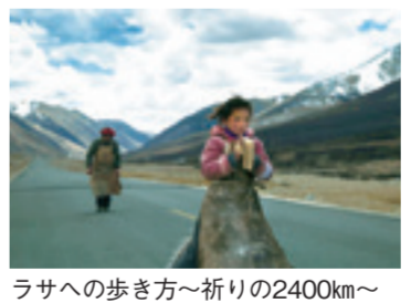
ラサへの歩き方～祈りの2400km～