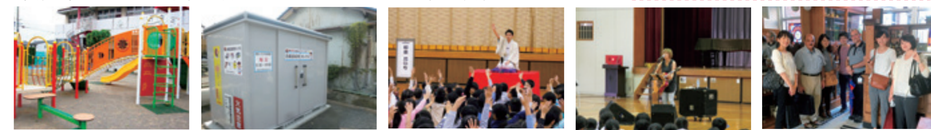
総合遊具設置事業(恵光学園) 古紙回収用ボックス設置事業 子どもの感性を育てるアートライブ ウェルカム！アーティスト 国際交流奨学金(薬科大学)

平成28年度もさまざまな事業に活用させていただきました。その一部をご紹介します。