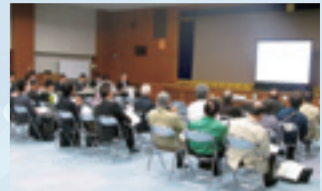
▲市民説明会の様子

そして、平成27・28年度に基本・実施設計を作成し、今日に至っています。また、本事業を進めるにあたっては、「市民に開かれた新庁舎」の実現のため、市民説明会や市民ワークショップなどを開催し、市民の皆さんのご意見を丁寧にお伺いし、でき得る限り活用させていただいています。現在も引き続き、市民の皆さんのご意見をお待ちしておりますので、お気軽にお寄せください。