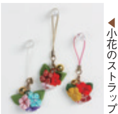
◀小花のストラップ

150年から40年くらい前の日常生活で使われていた「ちょっと昔の道具たち」を見て、触れて、体験できる展示会。第1・2日曜日と1月28日(日)には「昔のおもちゃ作り教室」を開催します。作るおもちゃは日によって違い、出来あがったものは持ち帰りできます。玩具クリエイターやものしり博士と一緒に作るのも、初めてのお子さんも大歓迎! ◆観覧料 高校生以上300円(240円)、小中学生150円(90円) ※(一)は20人以上の団体料金。 ※各種障害者手帳をお持ちの方とその介護者1人、市内在住の70歳以上の人は証明書などを提示すると無料。市内の中学生以下の方は無料。家庭の日(1月21日・2月18日各日)に入館する中学生以下の人とその家族は無料。 ◆開館時間 午前9時〜午後5時(入館は30分前まで) ◆休館日 毎週月曜日(1月8日・2月12日は開館)、年末年始(12月28日(木)〜1月3日(水))、1月9日(火)、2月13日(火) ◆場所・図 歴史博物館(大宮町2-18-1) ☎2650010