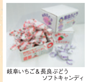
岐阜いちご&長良ぶどうソフトキャンディ