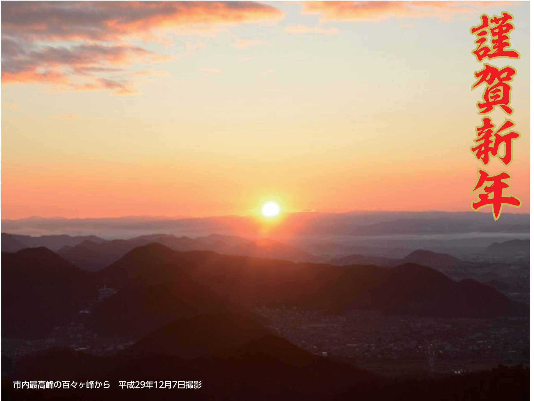
市内最高峰の百ヶヶ峰から 平成29年12月7日撮影