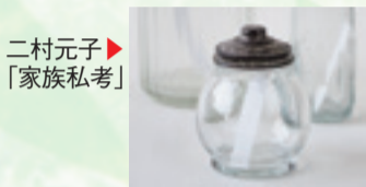
二村元子 ▶ 「家族私考」