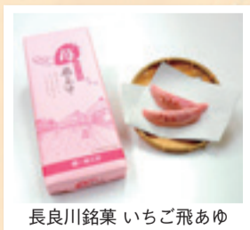
長良川銘菓 いちご飛あゆ