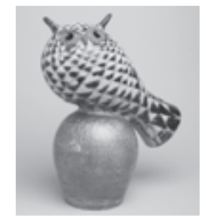
ミハエル・シルキン(彫像(鳥))1950年代 アラビア製陶所 コレクション・カッコネン ©KUVASTO, Helsinki & JASPAR, Tokyo, 2018 C2428

19世紀末、ロシアからの独立の気運が高まる中で誕生した独創的なフィンランドの陶磁器は、20世紀中期には世界的な潮流を生み出すまでに成長しました。本展では、19世紀末の黎明(れいめい)期から最盛期の1950、60年代までの作品をとおして、フィンランド陶芸の魅力を紹介します。