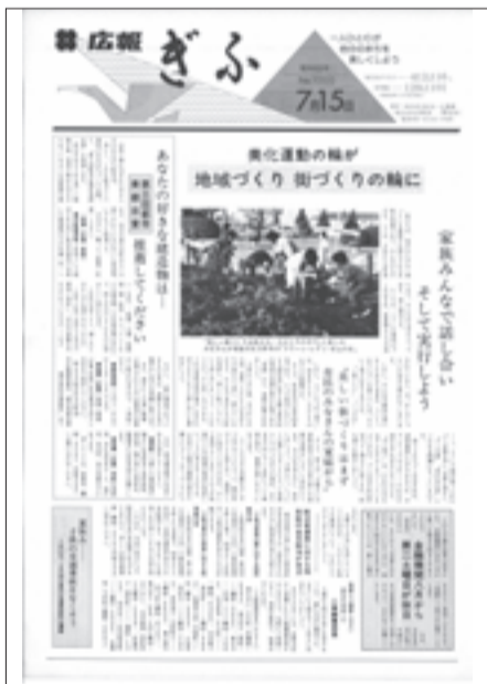
1983(昭和58)年7月15日号 創刊から1000号を迎える