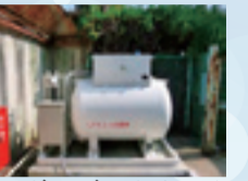
▲ガスパルクタンク