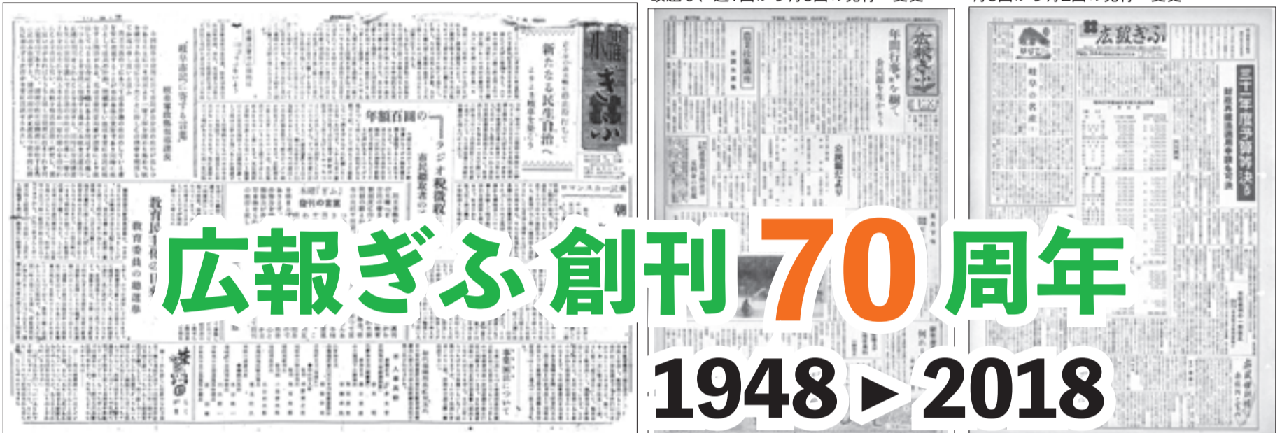
1956(昭和31)年4月15日号 月3回から月2回の発行へ変更