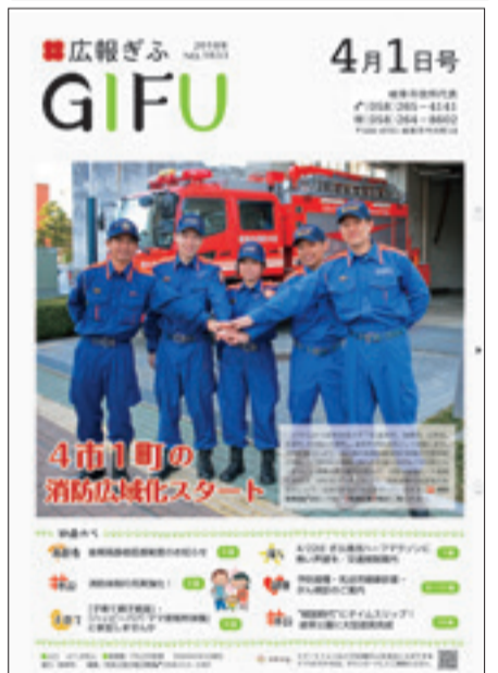
2018(平成30)年4月1日号 現在のデザインへ

「広報ぎふ」は、昭和23年9月2日の創刊以来、市民の皆さんとともに歩み、この9月で創刊70周年を迎えました。創刊時と比べると、名称は「木曜ぎふ」から「広報ぎふ」に、発行は「週1回」から「月2回」へと変わりましたが、市の