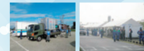
▲防災広場(イメージ)

「みんなの広場 カオカオ」は、安全性など必要な基準を満たしていることから、「岐阜市地域防災計画」において、指定緊急避難場所に位置付けています。