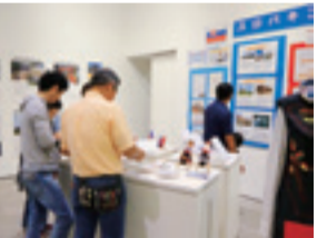
▲講演会とあわせて「スロバキア展」を開催(5月8日~14日)

岐阜市は、2020年東京大会に向け、市民の皆さんとともにスポーツや文化など幅広い分野で、スロバキア共和国とのホストタウン交流を進めています。 問 国際課 ☎214-6125