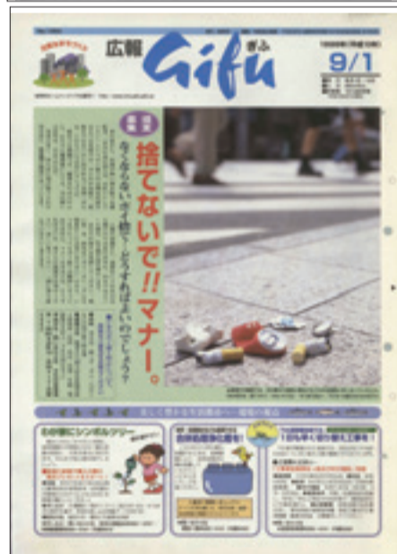
1998(平成10)年9月1日号 創刊から50周年を迎える