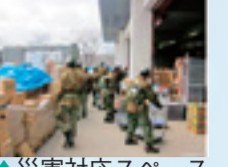
▲災害対応スペース(イメージ)

屋根のある大きなスペースを生かし、災害大型車両の駐留や支援物資の集積、荷さばきスペースとして活用します。