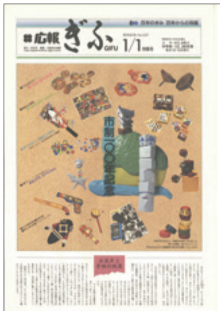
1988(昭和63)年1月1日号 初のカラー表紙