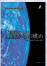
制作：合同会社アルタイム 画像：NASA(アメリカ航空宇宙局)

高度400kmに建設された宇宙に浮かぶ「国際宇宙ステーション・ISS」。ここから見る世界最高の眺望は、どのような景色なのでしょう。ISSから見た地球をプラネタリウムで体感しよう。★放映時間 火～金：午後1時～、午後4時～／土・日・祝日：午後1時～ ※特別放映などで放映がなくなる場合があります。詳しくは科学館ホームページをご覧ください。★観覧料 高校生以上610円、3歳～中学生200円 ※市内在住の中学生以下は無料 ★休館日 月曜日(祝日は開館)、祝日直後の平日 ★場所・図 科学館(本荘3456-41・☎272-1333)