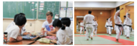
▲岐阜中央中学校の生徒と交流 ▲岐阜市体育ルームでの練習

市内施設を視察し練習を行いました。また、岐阜中央中学校で給食を体験したり、市民空手道大会で形を披露するなど交流も行いました。(7月12日~20日)