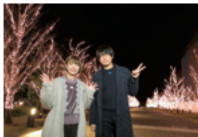
↓過去の番組の一部は岐阜市公式YouTubeチャンネルでもご覧になれます。

今回は、冬の魅力として長良川温泉とイルミネーションをピックアップ。長良川温泉は、旅館自慢の温泉や絶景が魅力の露天風呂、さらに、来年の大河ドラマに合わせて企画された料理などを紹介します。イルミネーションは、メディアコスモスと岐阜駅北口駅前広場のイベントの様子をお伝えします。ぜひ、ご覧ください。