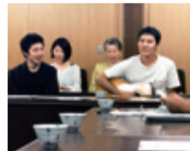
▲打ち合わせの様子

番組では、開催に向けて準備を進める関係者や出演者にスポットを当ててお伝えします。