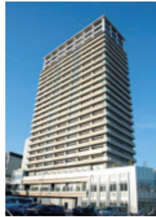
↑岐阜イーストライジング24