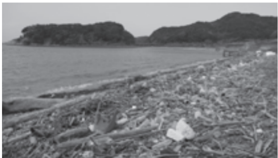
海岸に散乱するプラスチックごみ

県内で発生したプラスチックごみの一部は、河川を経由して海に流れ込み、海洋汚染の一因となっています。海岸に漂着するごみの約7割がプラスチックごみで、その約半分を飲食用の使い捨てプラスチックが占めています。県では、プラスチックごみを削減するため、使い捨てプラスチック使用量の削減に向けた取り組みを進めています。