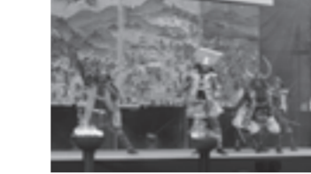
関ヶ原の戦いを再現するステージショー