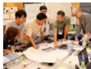
↓過去の番組の一部は岐阜市公式YouTubeチャンネルでもご覧いただけます。

柳ヶ瀬では、点在する空き家や空きビルなどの遊休不動産を活用し、エリアの新しい価値を作り出す「リノベーションまちづくり」が民間主導の公民連携で進んでいます。今回は、その一策として開催された新たなまちづくりの担い手を育成する「リノベーションスクール」の様子を紹介するとともに、2020年東京オリンピック・パラリンピックの「ホストタウン」である本市の取り組みについてお伝えします。