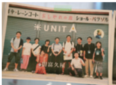
①②遊休不動産などを見学する様子 ③④⑤物件活用案について議論する様子 (写真はいずれも「リノベーションスクール@岐阜」の様子<8/30~9/1>)

市では、今ある資産を活かし、新しい使い方をしてまちを変える「リノベーションまちづくり」を推進しています。8月30日~9月1日には、「リノベーションスクール@岐阜」を開催し、柳ヶ瀬地区の実際の遊休不動産を対象に、受講者によるエリア再生を前提とした物件活用案の提案が行われました。今後も、空き家や空きビルなどの遊休不動産と、人や文化、産業などの潜在的な地域資源を組み合わせ、まちの活性化や課題解決につなげる取り組みを進めていきます。☎ まちづくり推進政策課 214-4494