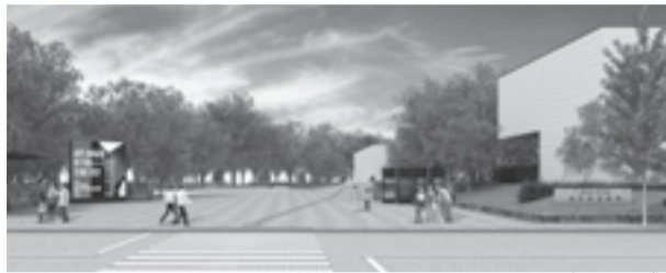
リニューアルした南門(イメージ)

◆期日 11月3日(日・祝) ◆場所 県美術館(岐阜市宇佐4-1-22) ◆料金 入場無料