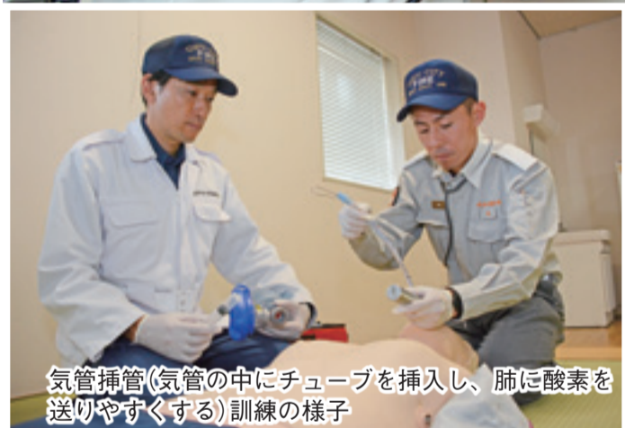
気管挿管(気管の中にチューブを挿入し、肺に酸素を送りやすくする)訓練の様子

岐阜市消防本部管内のすべての消防署に高規格救急車を配置し、病院までの搬送中、救急救命士が高度な救命処置を行える体制を整備。