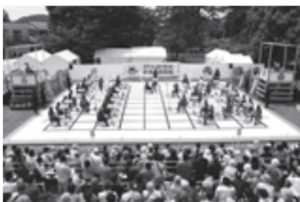
天下分け目の関ヶ原「東西人間将棋」

関ヶ原の戦いや東西対決にスポットをあてたイベントを開催します。天下分け目の関ヶ原「東西人間将棋」や棋士とめぐる古戦場ウォーキング、関ヶ原の戦いを再現する寸劇、東日本と西日本の麺や肉の有名店による「東西グルメ対決」などを実施します。