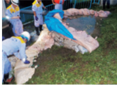
昨年7月の豪雨では、河川からの漏水を防ぐために月の輪工を実施