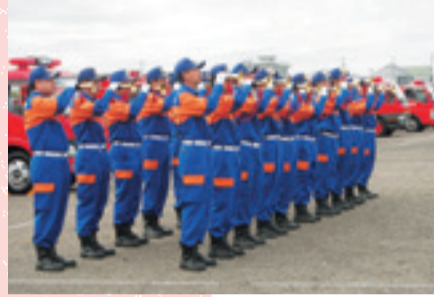
団員で結成するらっぱ隊は、行事などで活躍!