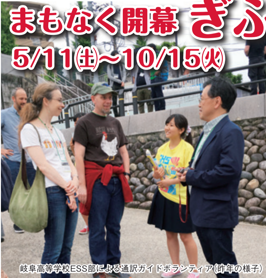
岐阜高等学校ESS部による通訳ガイドボランティア(昨年の様子)