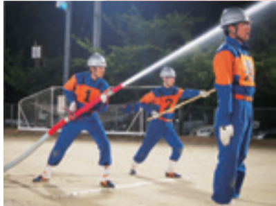
火災に備えて、放水などの訓練を行う消防団員

消防団員は、市内の中・南・北消防団のもと、特別職(非常勤)の地方公務員として、現在約1,200人が活動しています。普段は自分の仕事をもちながら訓練や火災予防啓発を行い、災害時には消防団員として地域のために活躍します。