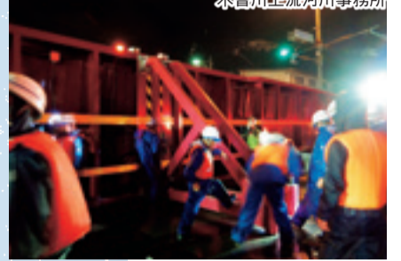
昨年7月の豪雨では、長良・大宮陸閘(りっこう)を14年ぶりに閉鎖