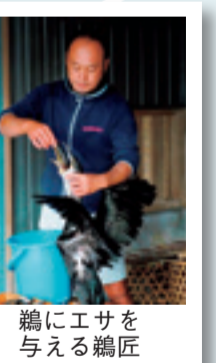
鵜にエサを与える鵜匠