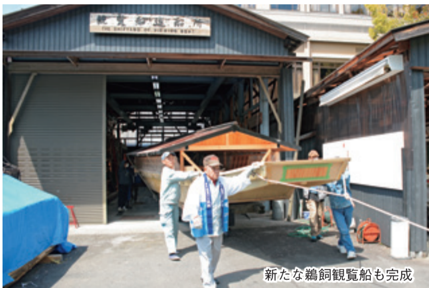
新たな鶺鴒観覧船も完成

1300年以上の歴史を誇る“ぎふ長良川の鶺鴒”は、「令和」となって初めてのシーズンを迎えます。今年も、鶺鴒の検診や新たな鶺鴒観覧船の建造、岐阜高校ESS部による外国人観光客への通訳ガイドボランティア活動など、5月11日の開幕を目前に控え、準備は順調に進んでいます。