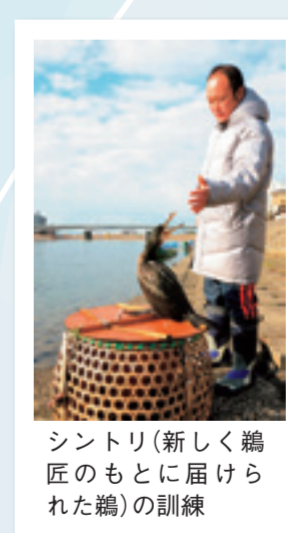
シントリ(新しく鵜匠のもとに届けられた鵜)の訓練

日本の歴史上、時の権力者は野生動物を使役して行う鷹狩や鵜飼を保護してきました。現在、茨城県日立市で捕獲された野生の鵜を鵜匠が訓練して漁を行います。鵜の野生性を重視して飼育する技術が日本の鵜飼の特徴です。