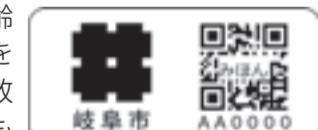
▲「見守りシール」みほん

認知症により行方不明となるおそれのある高齢者などの早期発見・保護のため、見守りシールを配布します。見守りシールの利用者は万一の事故発生に備え、個人賠償責任保険に加入することもできます。 ◆ 見守りシールの仕組み ①QRコード@が印字された見守りシールを衣服や持ち物などに貼り付ける ②発見者がスマートフォンなどでQRコードを読み込む ③インターネット上の伝言板を通して発見者と介護者で連絡を取ることができる ◆ 対象者 次のすべてを満たす人 ①市内在住 ②自宅で生活している ③過去に認知症により行方不明となったことがある ◆ 費用 無料 ◆ 受付開始日 6月1日(月)～ ◆ 申請方法 開 申請書を郵送または開庁日時に直接高齢福祉課(〒500-8701今沢町18本庁舎高層部1階・☎214-2090)へ。※申請書は同課または市ホームページで入手可