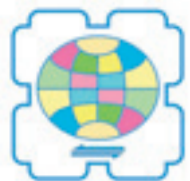
▲岐阜市多文化共生シンボルマーク

「岐阜市多文化共生推進基本計画 ーたぶんかマスタープラン2020～2024ー」を策定しました