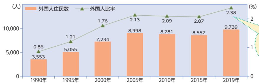
【岐阜市における外国人住民数と外国人比率】 資料：岐阜市国際課調(各年12月31日現在)

外国人市民はともにまちづくりを担う一員であるという共通認識のもと、生活に必要なきめ細かな支援を行うとともに、地域において自治会をはじめとするコミュニティ、学校、企業などと連携し、多様性を生かした活気に満ちたまちづくりをオール岐阜の体制で進めます。