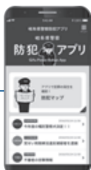
アプリ画面 ※画面はイメージです