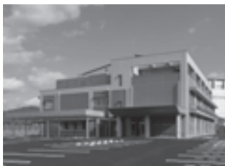
県障がい者総合就労支援センター外観

障がいのある方の就労を総合的に支援するため、県障がい者総合就労支援センターが、障がい者支援の拠点であるぎふ清流福祉エリア内に4月にオープンします。