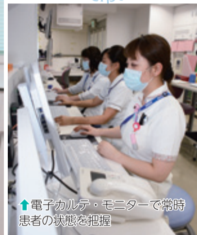
↑電子カルテ・モニターで常時患者の状態を把握