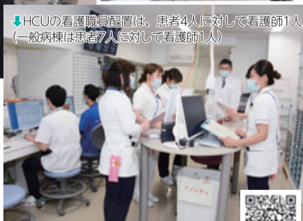
↓HCUの看護職員配置は、患者4人に対して看護師1人（一般病棟は患者7人に対して看護師1人）