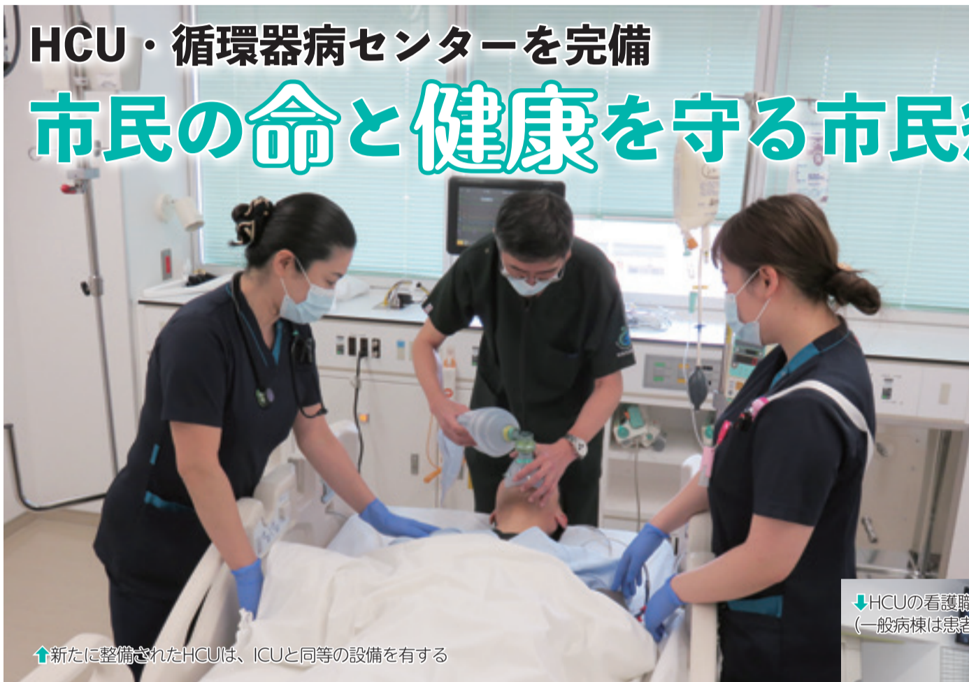
↑新たに整備されたHCUは、ICUと同等の設備を有する