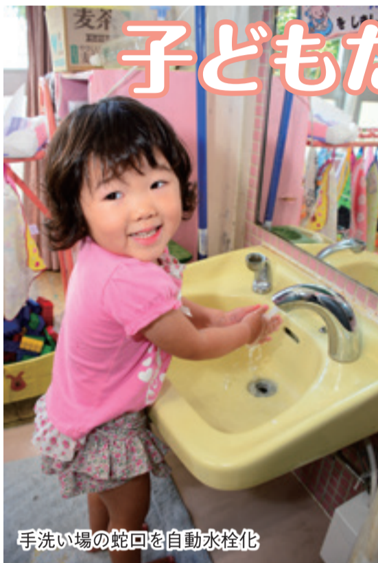
手洗い場の蛇口を自動水栓化