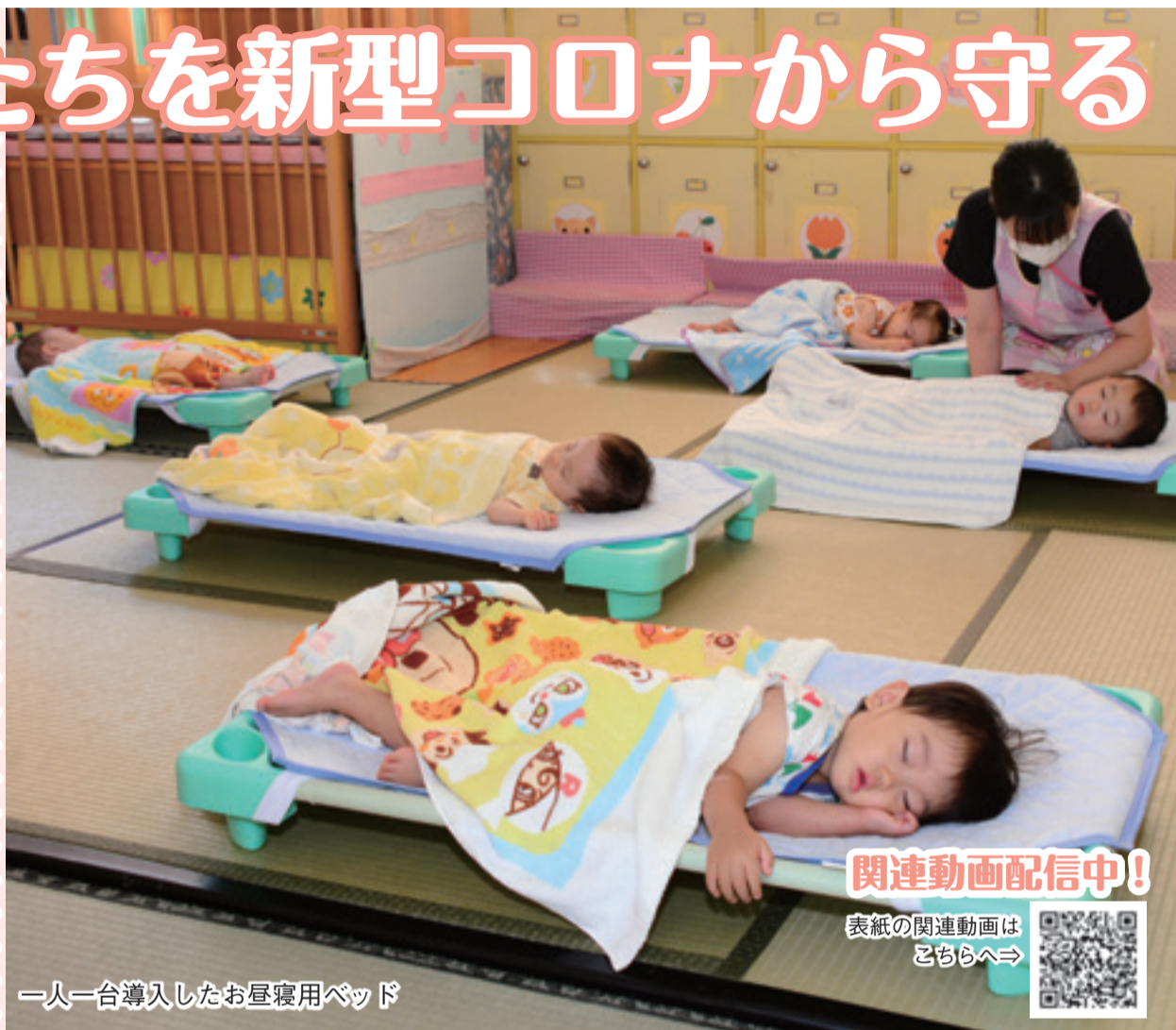
一人一台導入したお昼寝用ベッド