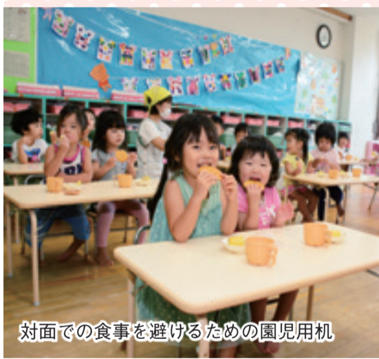
対面での食事を避けるための園児用机

岐阜市では新型コロナウイルス感染症への対策として、全ての公立保育所に一人一台のお昼寝用ベッドを9月末までに導入します。お昼寝用ベッドは、床との間に10cmほどの隙間があり、通気性がよく、水洗いもできるため、衛生面に優れています。また、一人一台利用することで、園児同士の距離を保つことができます。その他にも、手洗い場の蛇口の自動水栓化、対面での食事を避けるための園児用機の整備、おもちゃ用殺菌ロッカーの配備など、感染症対策を進めています。保育所に保護者が安心して子どもを預けられるよう環境を整えていきます。☎子ども保育課☎214-7825 [関連記事]5面に掲載