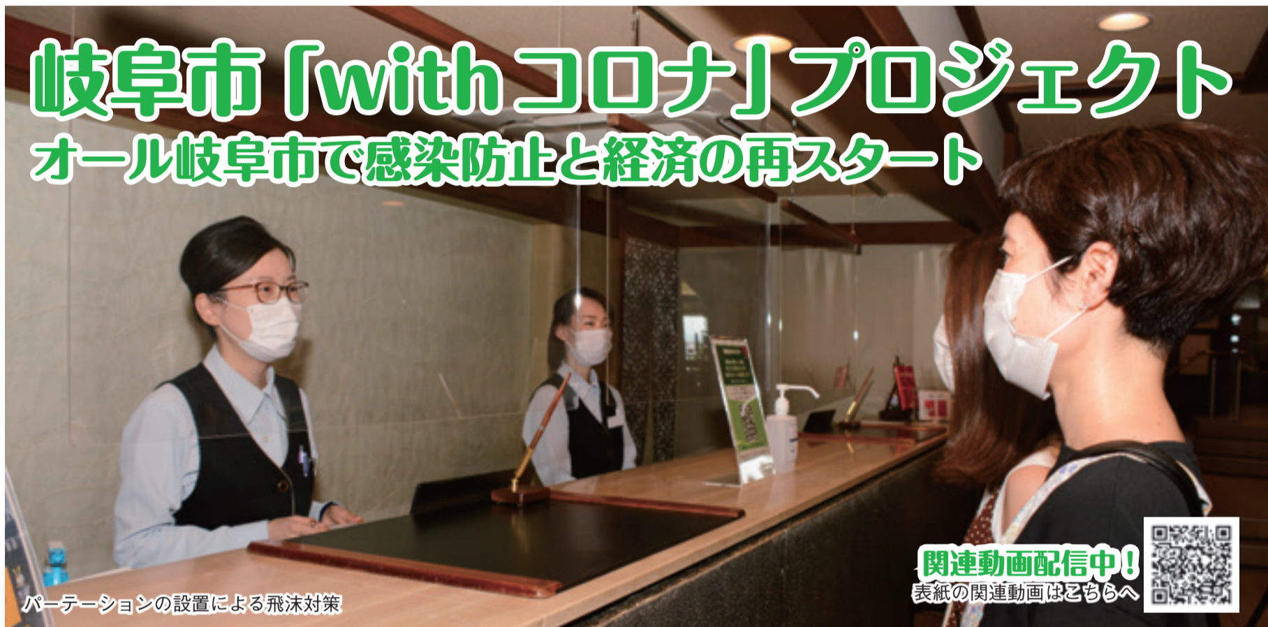
パーテーションの設置による飛沫対策