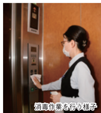
消毒作業を行う様子