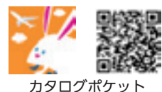
カタログポケット