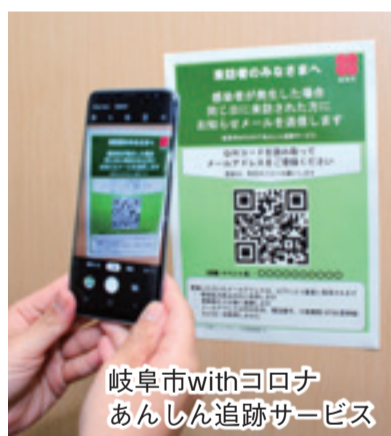
岐阜市withコロナあんしん追跡サービス