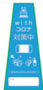
▲ withコロナステッカー

新型コロナウイルスの感染防止と経済の再スタートを実現するため、「withコロナステッカー」を通じて感染防止対策の取り組みを宣言する“事業者”、感染の回避に努める“市民”、感染防止対策の周知啓発および支援を行う“行政”が一体となったオール岐阜市の取り組みを進めています。取り組みを宣言した事業者は、店舗内の消毒や接客場所へのパーテーションの設置など、感染防止対策に努めています。店舗などを利用する際には、マスクの着用や手洗い・消毒、岐阜市withコロナあんしん追跡サービス※の利用など、事業者の取り組みに協力し、感染の回避に努めましょう。問 産業振興・企業誘致課 ☎214-2360 ※店舗などに掲示されたQRコード®を読み取り、メールアドレスを登録すると、感染者と接触した可能性がある場合にメールでお知らせします